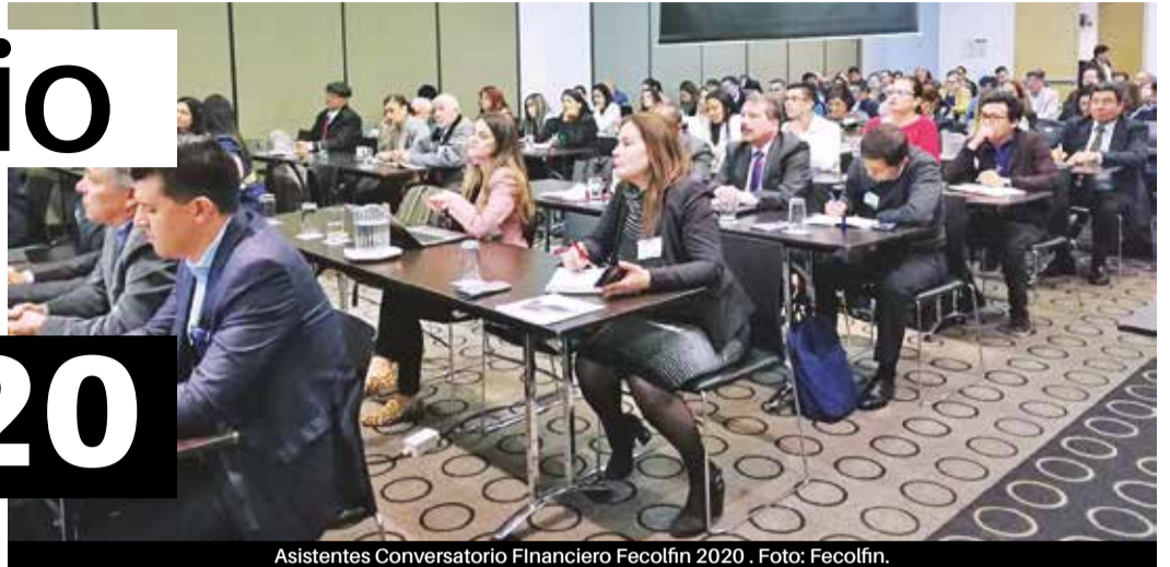
Asistentes Conversatorio Financiero Fecolfin 2020.