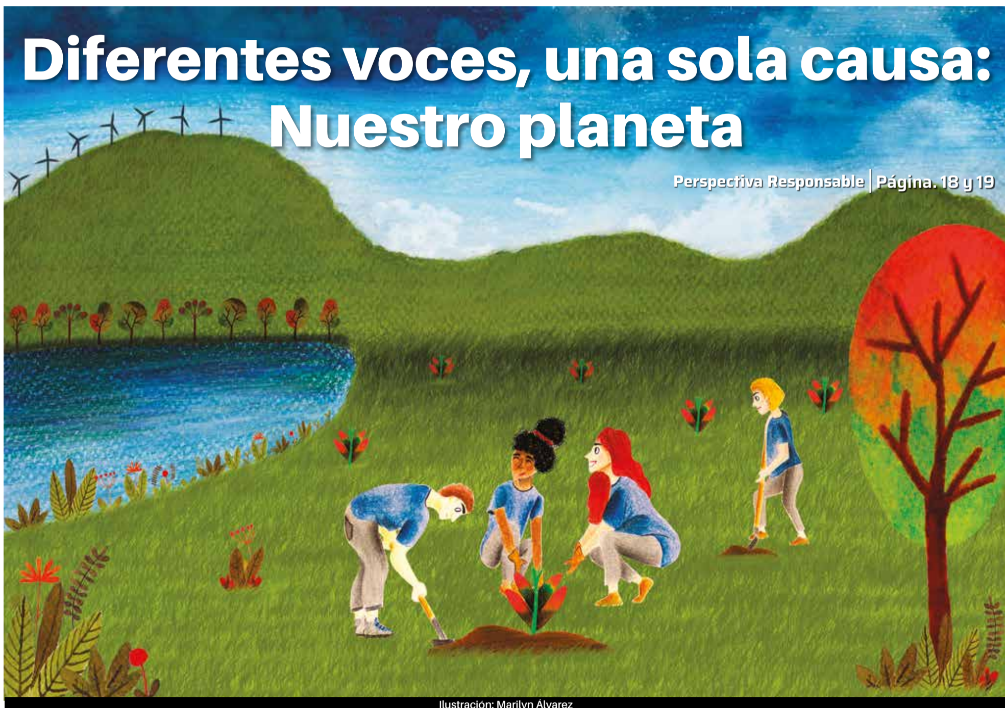
Ilustración: Marilyn Álvarez

Perspectiva Responsable | Página. 18 y 19