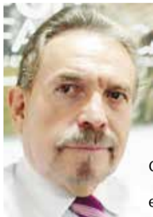
Por: Carlos Pineda, Consultor internacional, Economista, Magister en ciencias económicas

A unque para el año 2020 las perspectivas económicas mundiales están signadas por un crecimiento lento y desafíos normativos, la economía mundial solo mostrará un ligero repunte. En el período se acelerará el crecimiento de los mercados emergentes y las economías en desarrollo ya que algunas economías emergentes superarán el período recesivo; no obstante, el aumento de la deuda y la desaceleración del crecimiento de la productividad plantean desafíos para los encargados de la formulación de políticas. La lenta recuperación estará amenazada por dos tendencias: el aumento sin precedentes de la deuda a nivel mundial y la prolongada desaceleración del crecimiento de la productividad. Según lo previsto por el Banco Mundial, en el 2020, el crecimiento mundial será del 2,5%, ligeramente superior al 2,4% registrado en el 2019. A su turno, el crecimiento per cápita se mantendrá muy por debajo de los promedios a largo plazo lo que impedirá alcanzar los objetivos de erradicación de la pobreza.