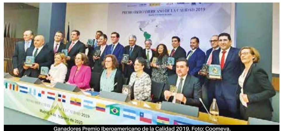
Ganadores Premio Iberoamericano de la Calidad 2019.

La Fundación Coomeva, nació en 1989 como una entidad del Grupo